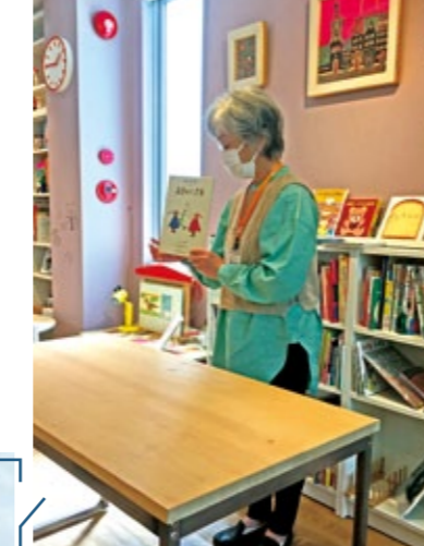
2日目 アトリエロッタ にて発表会