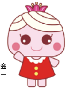
高松市社会福祉協議会 イメージキャラクター 「なごみちゃん」

住所：高松市福岡町二丁目24番10号 (福祉コミュニティセンター・高松) 電話：087-811-5666 F A X：087-811-5256 メール：takas001@mail.netwave.or.jp