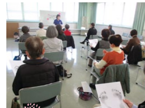
協会会員研修