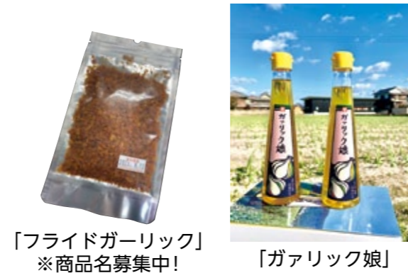
「フライドガーリック」 ※商品名募集中!

「ガリック娘」を製造する工程から出る副産物が年間3トン廃棄されており、食品会社からSDGsの取組も視野に入れ、それらを再利用できないかとの相談がありました。