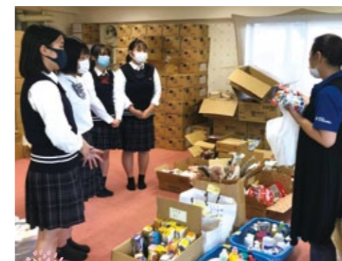
フードバンクの仕分け

また、高松市社協の事業でも、住民参加型事業での協力会員として、掃除、調理・洗濯といった家事支援、一人での外出が不安な方に対する通院・外出支援の活動への参加や、フードバンク事業での食料品の仕分けに参加していただくなど、多様な場面で、地域の方にご活躍いただいております。