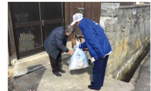
訪問型サービスBでの生活支援 (ささえあい活動報告より)