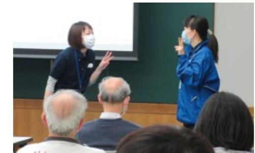
高松市介護予防・生活支援サービス 提供者養成研修 (facebookより)

高松市社会福祉協議会では、そのような活動を支援するため、介護予防・日常生活支援総合事業や共助の基盤づくり事業などの地域の担い手養成を行い、地域福祉活動へ参加したい方への支援を行っています。