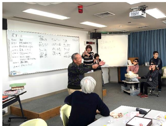
ジェスチャーをしている参加者の様子

聴覚障害をお持ちの方との交流では、参加者一人ひとりが手話で自己紹介をしました。その後、「1月で連想するものは？」というテーマのもと、連想する単語をジェスチャーで表したり、その単語の手話を教えてくださいました。参加された方からは、「手話以外にもジェスチャーや筆談などで会話することができる」と感想をいただき、聴覚障害について、知るきっかけになったと感じました。