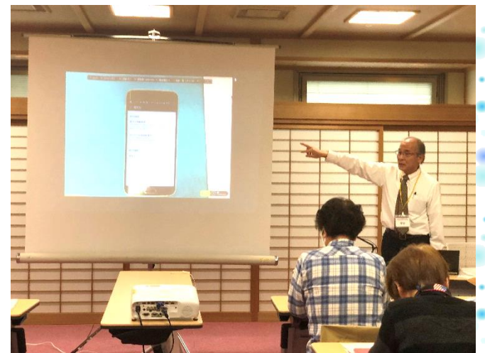
プロジェクターを使い、説明する NPO法人シニアネットかがわさん

講座の後半で行ったLINEの講習では、友達追加の方法や写真を送信する方法、グループLINEを作る方法を教えていただきました。最後に、LINEのおさらいとして、高齢者いきいき案内所の公式LINEを参加者全員に友達追加していただき、講座を修了しました。