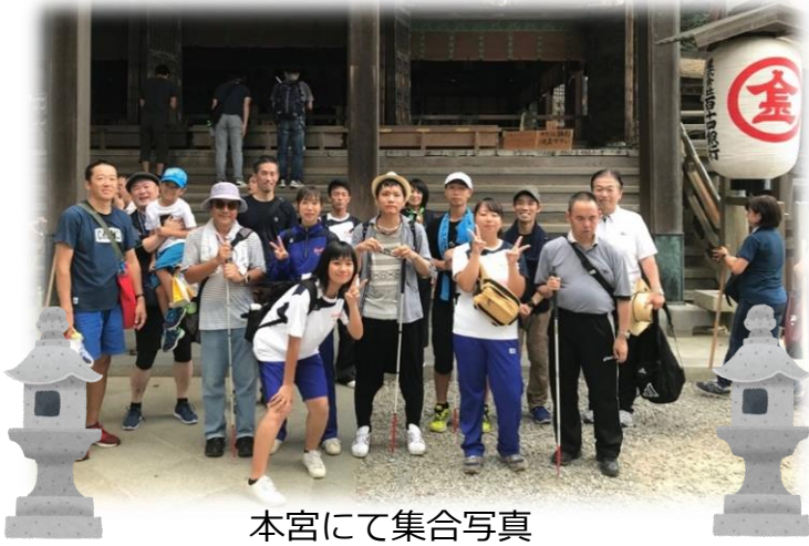
本宮にて集合写真

高齢者いきいき案内所では、今後もこういった機会を作っていきたいと考えております。