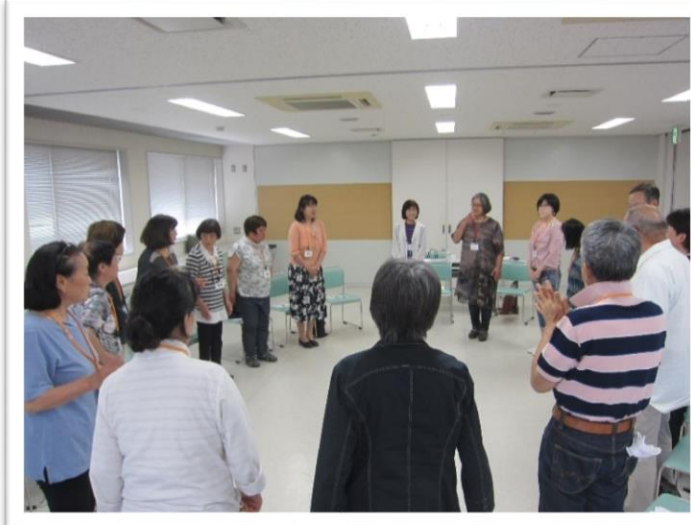
写真 左 第1日目 右 第2日目 右下 第3日目 ふたな荘