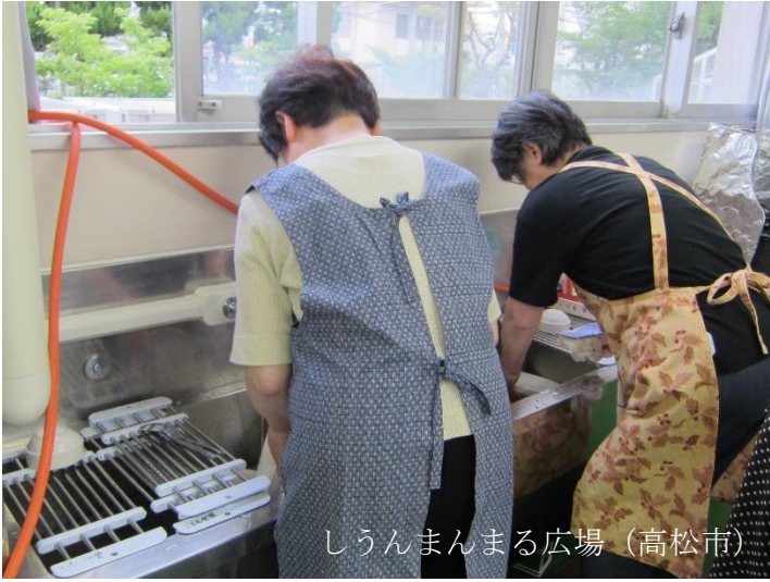
しounまんまる広場（高松市）