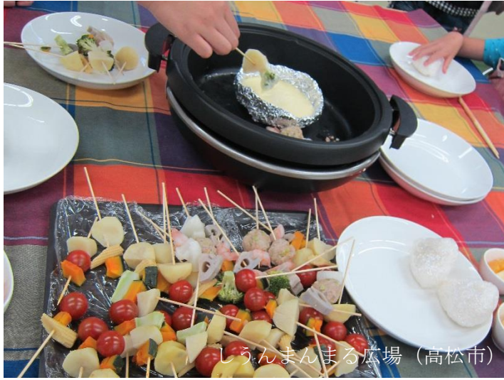
しounまんまる広場（高松市）

香川県内には、28か所*の子ども食堂があり、子どもの食と居場所の役割を担っています。