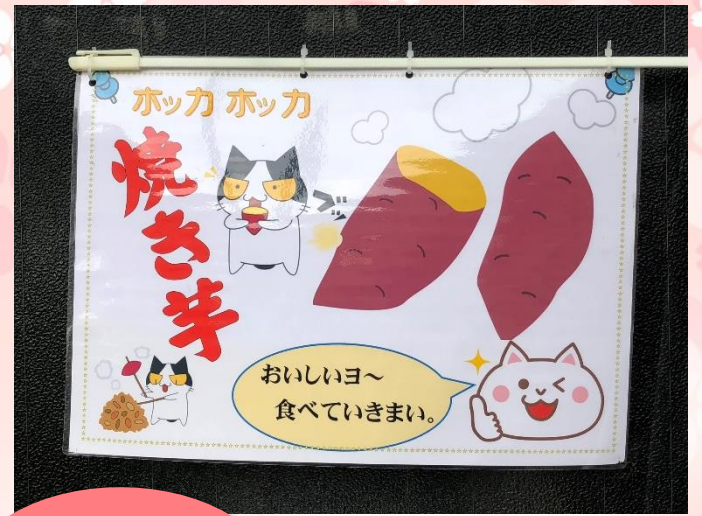
焼きたてのお芋はホックホックでした！