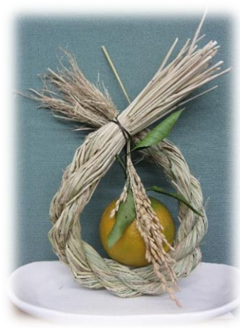
新年の願いを込めて