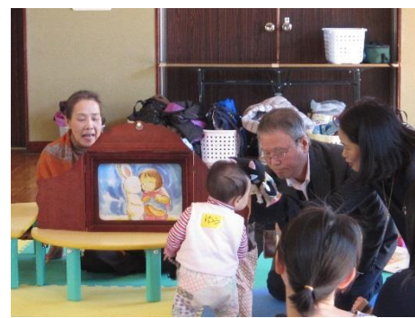
まんのう町で 活躍の「あめ んぼさん」に 仲間入り。

エシカル消費とは、「エシカル」は英語で「倫理的、道徳的」などの意味で、人や社会、環境に配慮したフェアトレード商品、エコ商品、リサイクル商品、被災地産品などの購入を積極的に行う消費活動のことです。