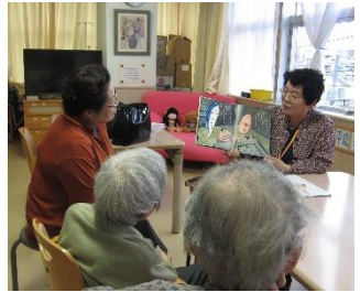
お話前の 読み聞かせ