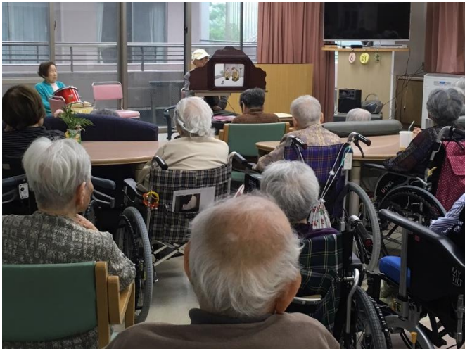
ご夫婦で 仲良く 活動中。