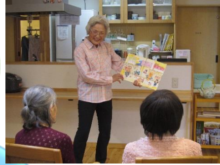
平成29年度修了生の会 読み聞かせ「ふくふく」