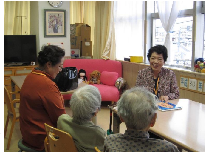
読み聞かせ後、 絵本の内容から 話題が始まって いきます。