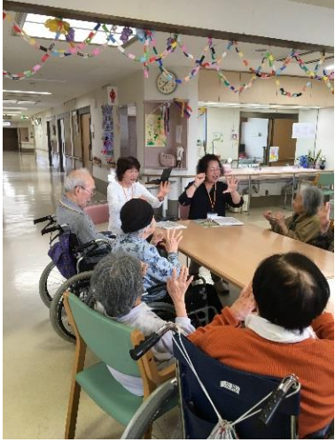
平成28年度修了生の会 読み聞かせグループ 「ポピィの会」

平成27年度から開講している「読み聞かせボランティア養成講座」の修了生の活動は、一緒に学んだ仲間とグループを結成したり、既存のグループに仲間入りさせていただいたりしながら、学んだことを地域で活かすようにしています。また、傾聴やお話し相手の活動に、読み聞かせを加えることで会話を広げることにつながっています。読み聞かせ活動や活用の仕方について、参考にいただければと思います。